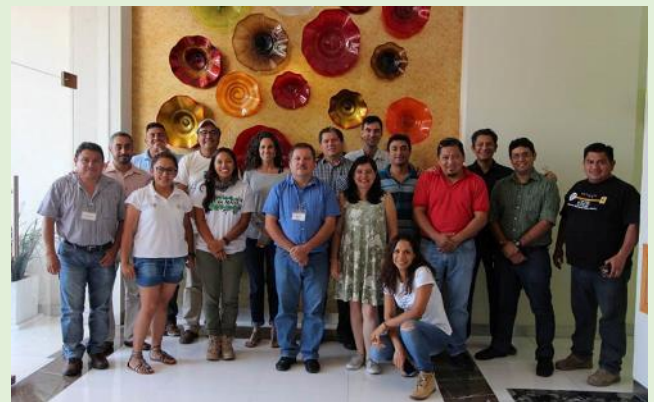
Asistentes al Taller SMART, en Chetumal, México.

Una de las primeras actividades ha sido el Taller de Construcción del Modelo de Datos SMART, celebrado del 4 al 5 de diciembre en Chetumal, México; con el objetivo de definir la estructura de la base de datos SMART y los parámetros a registrar por el personal de las ANPs. En el taller participaron directivos y personal técnico de la Dirección Regional Península de Yucatán y Caribe Mexicano de la Comisión Nacional de áreas Naturales Protegidas (CONANP), la Secretaría de Medio Ambiente de Quintana Roo, la Coordinación Regional en la Península de Yucatán de la Comisión Nacional para el Conocimiento y Uso de la Biodiversidad (CONABIO), la Unión Internacional para la Conservación de la Naturaleza (UICN) y expertos en SMART de la Wildlife Conservation Society (WCS).