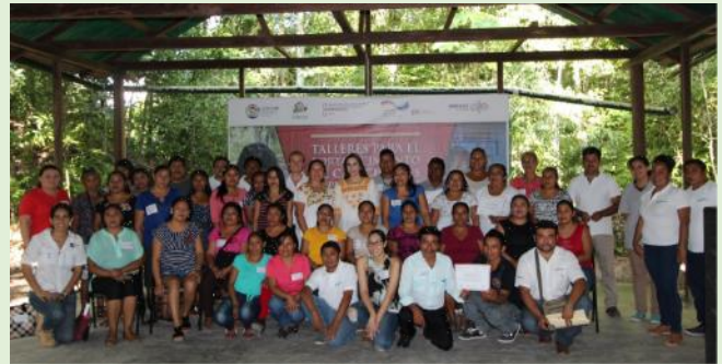
Clausura Ciclo de Talleres de Fortalecimiento empresarial en Centro Ecológico La Raíz del Futuro

El 20 de noviembre, en la sesión de clausura, los asistentes compartieron sus experiencias de aprendizaje y avanzaron la Estrategia de Desarrollo Empresarial 2018, que incluye formar una Red de prestadores de servicios y productores que fortalezca la oferta turística en Calakmul.