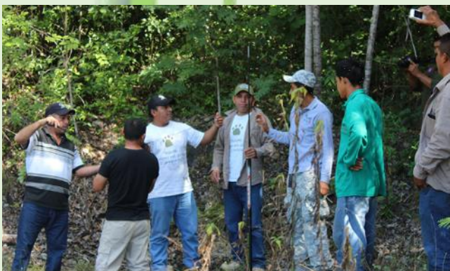
Actividades prácticas realizadas durante el intercambio

Con el objetivo de conocer el sistema de gobernanza de Corozal Sustainable Future Initiative (CSFI) Belice, y con ello fortalecer las capacidades de monitoreo, vigilancia y manejo de áreas protegidas; del 11 al 15 de diciembre de 2017 se llevó a cabo un intercambio de experiencias en la que participaron ocho integrantes de la Red de Vigilancia Comunitaria Muuch Kanan K'aax del Área de Protección de Flora y Fauna de Bala'an K'aax (APFFBK), Quintana Roo, en conjunto con la CONANP.