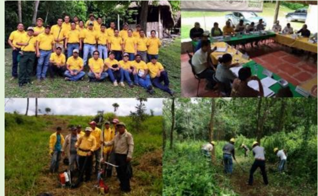
Capacitaciones en Petén durante 2017

APs; d) Apoyo para limpiar brechas en la Reserva de la Biosfera Maya; e) Apoyo en actividades de educación ambiental, sensibilización y capacitación; f) Capacitación a tomadores de decisiones del Petén sobre protocolos de activación de la Comisión de Operaciones de Emergencia y g) Socialización de la Guía de bolsillo del Guardarrecursos.