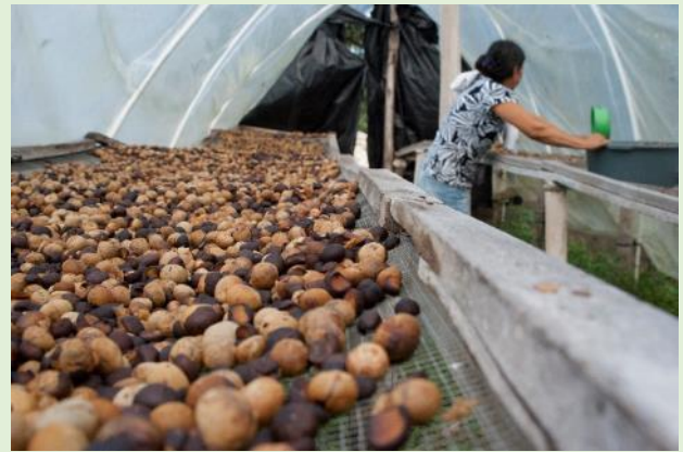
Colecta de semilla de ramón

A las cuatro organizaciones comunitarias fundadoras del Comité de Ramón en el 2012, se agregaron otras cinco aumentando el número de personas directamente beneficiadas a más que 500.