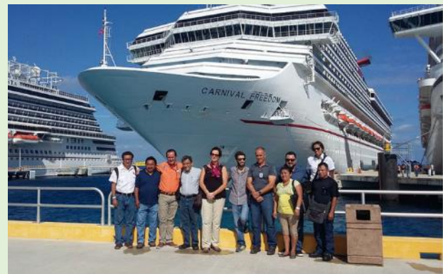
Comitiva de Calakmul, en el muelle Puerta Maya

La razón del intercambio radica justo en esta transferencia de conocimientos y experiencias que permitieron a los visitantes repensar aspectos de organización y planeación, considerando la creciente llegada de turistas a Calakmul y una estrategia de promoción para que el municipio se consolide como destino turístico.