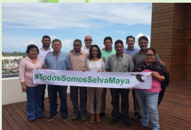
Asistentes a la tercera reunión GOC

La unificación de las agendas de los tres países que comparten la Selva Maya es crucial para fortalecer la integración regional y lograr los objetivos comunes de conservación de la biodiversidad y desarrollo sustentable en las comunidades rurales.