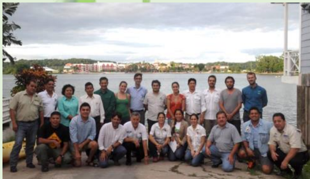
Asistentes al Taller Trinacional sobre Monitoreo de Aguadas y Fauna Asociada

El 26 de octubre, en Flores, Petén, Guatemala, se llevó a cabo el Taller Trinacional sobre Monitoreo de Aguadas y Fauna Asociada, con el objetivo de intercambiar experiencias sobre el tema y formar el Grupo Trinacional de Monitoreo de Aguadas y Fauna Asociada en la Selva Maya. Las aguadas son cuerpos de agua retenida de forma natural en las zonas selváticas y fungen como abrevaderos para la fauna silvestre.